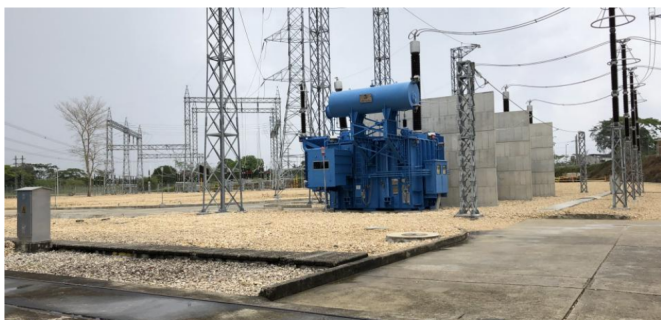
Una nueva planta con 230 voltios será la encargada de suministrar energía al norte del país.

RELACIONADOS: CÓRDOBA | MONTERÍA | ELECTRICIDAD