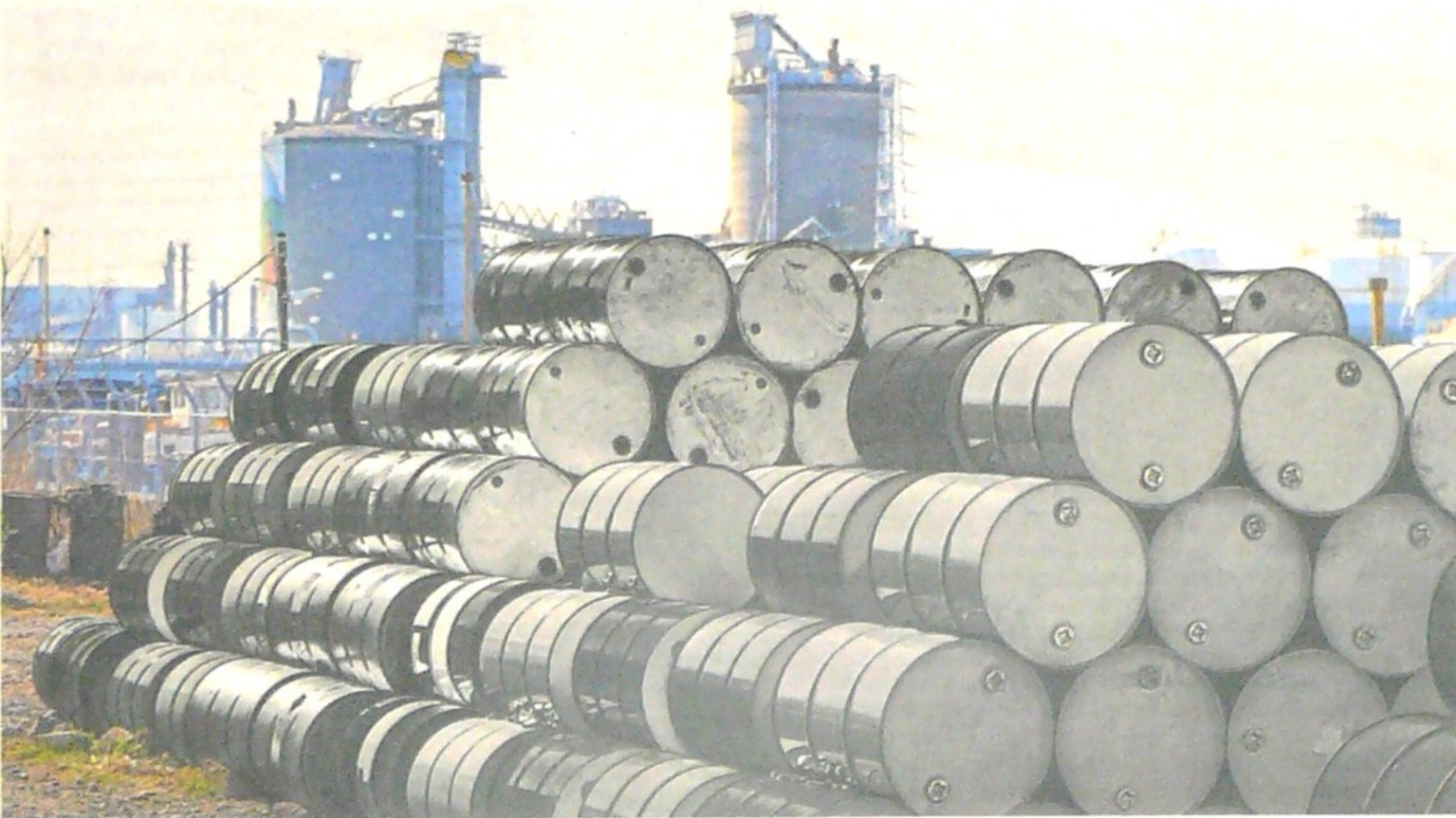
Entre enero y febrero, la producción promedio de crudo fue de 895.748 barriles día un 6,4% respecto a los dos primeros meses de 2018 (841.853 bpd).