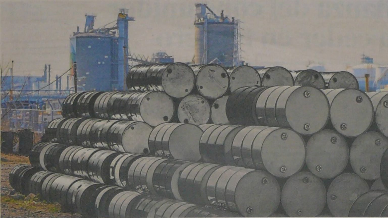
Entre enero y febrero, la producción promedio de crudo fue de 895.748 barriles día un 6,4% respecto a los dos primeros meses de 2018 (841.853 bpd).