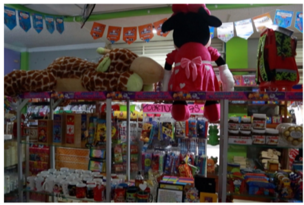
Esta papelería fue uno de los negocios intervenidos por las autoridades en Arauca.

Aunque no se trata de una incautación de bienes muy costosos, y las imágenes de las propiedades muestran que algunos de los negocios eran de muy bajo perfil (como papelerías), esta acción conjunta entre la Fiscalía y la Fuerza Pública, bautizada como 'Operación Rey', apuntó a un lugar de especial interés para el Eln y a un frente muy importante. Arauca, desde hace décadas, es la retaguardia del Eln, y el Domingo Laín está bajo el mando del hombre que nunca ha querido negociar la paz: Pablito .