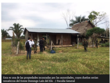
Esta es una de las propiedades incautadas por las autoridades, cuyos dueños serían testaferros del frente Domingo Laín del Eln.

Las propiedades están avaluadas en, aproximadamente, $6.500 millones. No es mucho dinero, pero sí es un golpe a uno de los frentes más importantes de esa guerrilla.