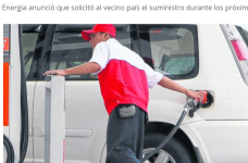
Las medidas prevén aumentar la capacidad de una línea de abastecimiento entre el puerto de Tumaco y Pasto.

POB: PORTAFOLIO • MARZO 19 DE 2019 - 05:48 P.M.