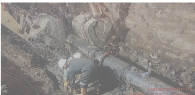
La reparación de este tramo del oleoducto, ubicado en zona rural de Arauca, se pudo adelantar una vez el Ejército recuperó el control del área, tres días después de la emergencia.

RELACIONADOS: Eln | ARAUCA | CÚCUTA | OLEODUCTO CAÑO LIMÓN COVEÑAS | NORTE DE SANTANDER