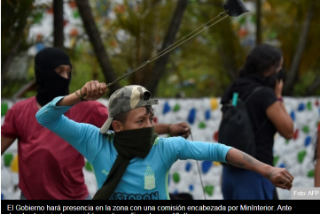
El Gobierno hará presencia en la zona con una comisión encabezada por MinInterior. Ante desabastecimiento, se pidió gasolina a Ecuador por 10 días.