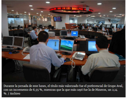
Durante la jornada de este lunes, el título más valorizado fue el preferencial de Grupo Aval, con un incremento de 6,55 %, mientras que la que más cayó fue la de Mineros, un 2,14 %

Este lunes el índice subió 1,69 % y cerró en 1.606 puntos, un nivel que no alcanzaba desde finales de 2014. Es solo superado por la Bolsa de China.