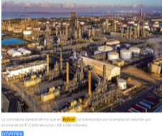
La Contraloría General afirma que en Reficar los sobrecostos por la ampliación estarían por encima de los $12 millones (unos US$ 4.000 millones).

POB: PORTAFOLIO - MARZO 18 DE 2018 - 07:55 PM