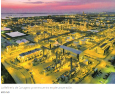
La refinería de Cartagena ya se encuentra en plena operación, al vivo.