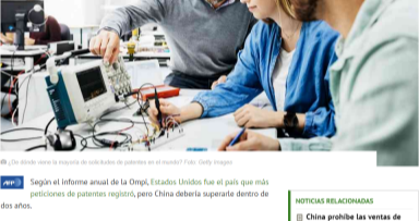
¿De dónde viene la mayoría de solicitudes de patentes en el mundo?

Más de la mitad de las solicitudes internacionales de patentes en 2018 procedieron de Asia, sobre todo de China, India y Corea del Sur, indicó la Organización Mundial de la Propiedad Intelectual (Ompi), una agencia de la ONU.