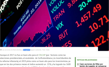
Las acciones de Bancolombia y Ecopetrol siguen subiendo.

El índice COLCAP que agrupa las acciones de las empresas con más liquidez en Colombia y que hoy vale más de 5 billones de pesos, ha tenido un comportamiento excepcional en los últimos dos meses.