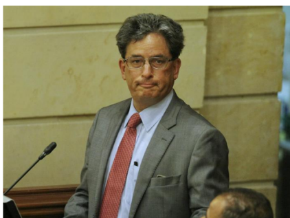
Alberto Carrasquilla, ministro de Hacienda de Colombia.

POR: BLOOMBERG - MARZO 18 DE 2019 - 09:27 A.M.