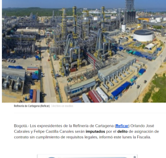
Refinería de Cartagena (Reficar)