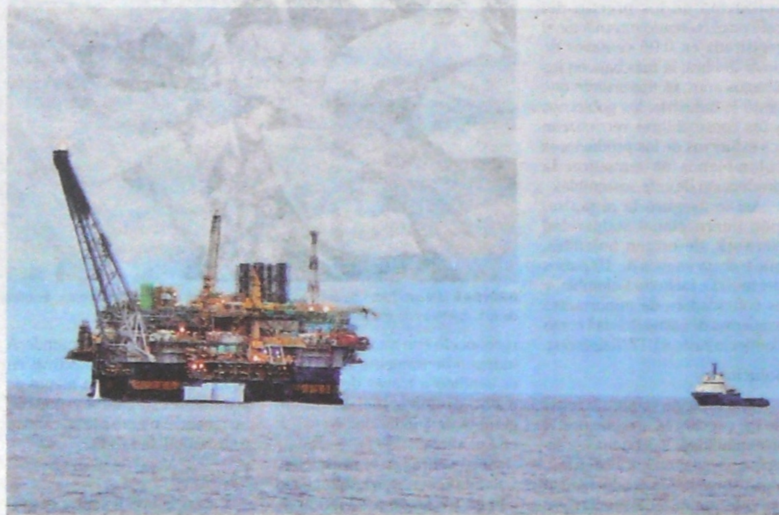
LA PRODUCCIÓN industrial estuvo jalonada por el sector petrolero en Estados Unidos.

"El alza en marzo se debe íntegramente a los hogares cuyos ingresos se sitúan en los dos tercios de la franja más baja", cuya confianza pasó de 90 puntos en febrero a 97,4 puntos, explicó