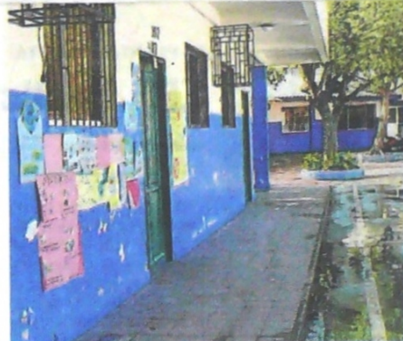
El vertimiento de las aguas residuales se produjo en el patio de la institución.

“Resulta que estaba tapado un registro cerca de la cafetería y cerca de los salones de primaria. Gracias a Dios ya están arreglando y confiamos en que no solo quede todo curado sino que no se vuelva a presentar otra emergencia de estas”, agregó la li-