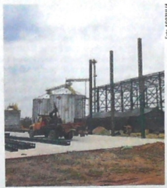
EL AVANCE DE LA OBRA es de un 92 %, esta mejorará costos y la producción en el distrito de riego.

El molino tendrá capacidad para procesar cinco toneladas de arroz cada hora y almacenar 4.000 toneladas.