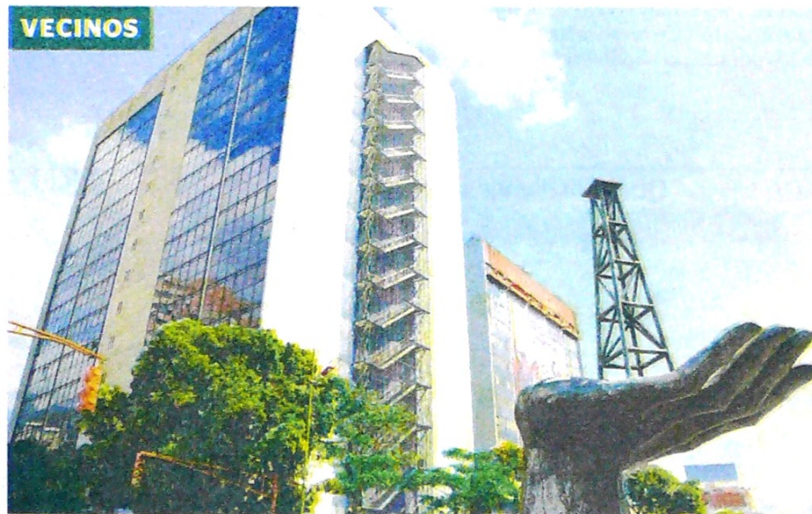
Pdvsa, que alcanzó a ser 'top' en el mundo, podría ser superada incluso por Ecopetrol. AFP