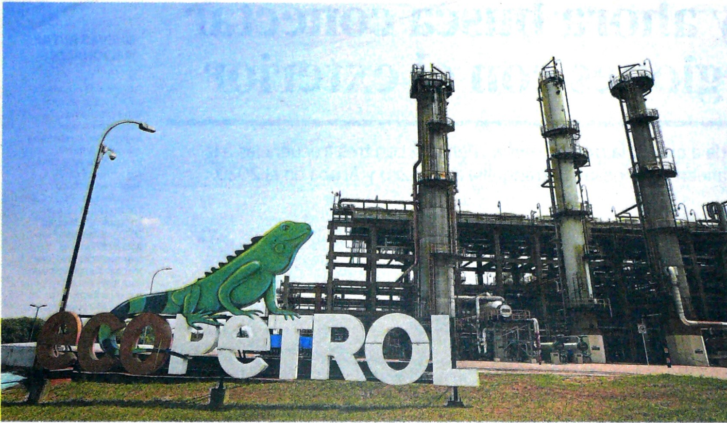
Ecopetrol tendrá una renovación casi total de su junta, según la propuesta que llevará el Gobierno a la próxima asamblea, que será el 29 de marzo.