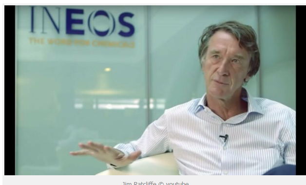
Jim Ratcliffe