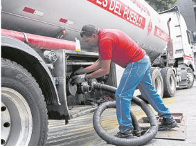
La empresa petrolera estatal Pdvsca llegó a ser la segunda mayor del sector en el mundo.

POR: PORTAFOLIO - MARZO 14 DE 2019 - 11:32 P.M.