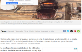
La configuración se realizó la noche del miércoles en Petros San Félix (estado Anzoátegui, norte), dijo el ministro de Petróleo y presidente de PDVSA, general Manuel Quevedo.

El gobierno atribuyó el hecho a una "acción terrorista" de Estados Unidos.