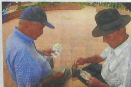
En el tratamiento tributario de las cuentas AFC y Pensiones Voluntarias, éstas seguirán en la categoría de exentas.

Los dineros depositados en dichas cuentas son considerados rentas exentas para el periodo gravable.