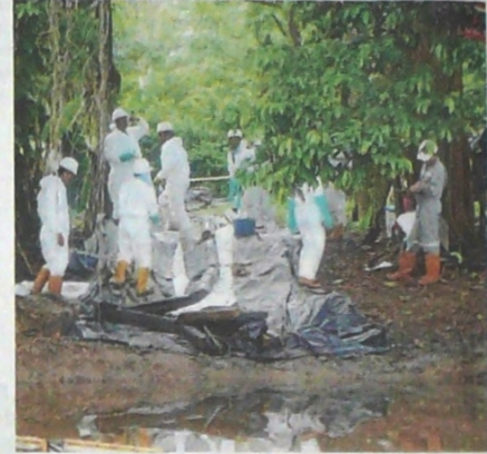
La limpieza de puntos específicos en donde aún se tiene presencia de petróleo sigue dándose en la zona afectada.

La limpieza fina (retiro de residuos de hidrocarburo en el lecho hídrico y en