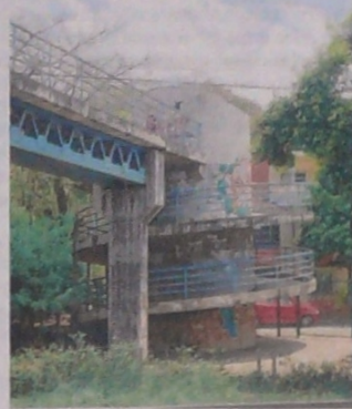
Sobre el Anillo Vial, en la vía que de Girón conduce a Floridablanca, se encuentra abandonado el puente peatonal de Castilla Real I.

Los pasos peatonales del área metropolitana son espacios propicios para la delincuencia. Además, los indigentes los tienen habilitados como sus dormitorios.