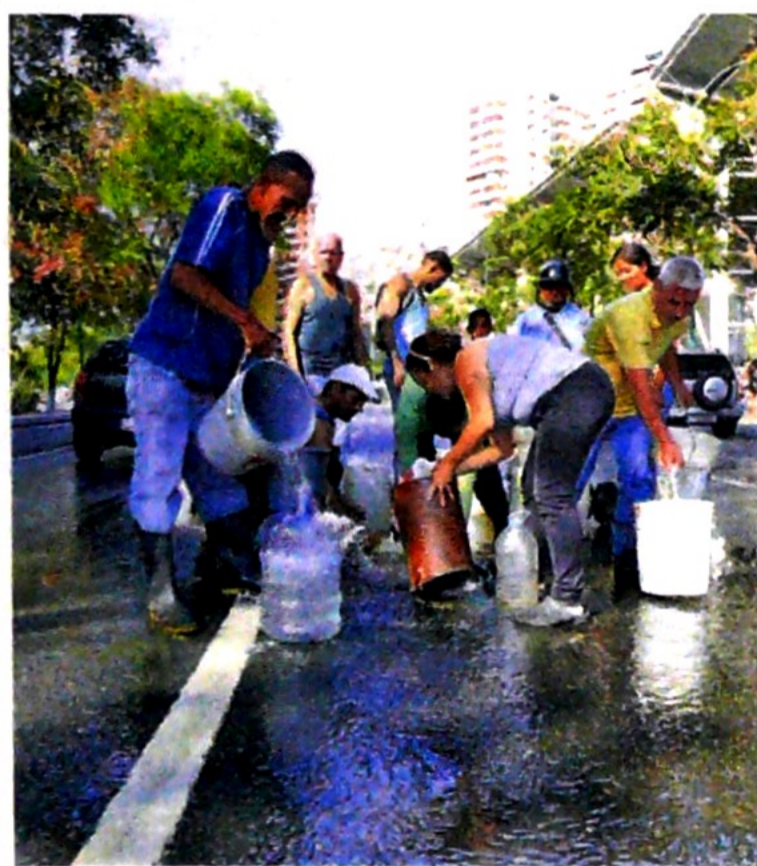
A la falta de comida y electricidad se sumó el corte de agua.

Según Ecoanálitica, las pérdidas por el apagón ascendían "a 875 millones de dólares".