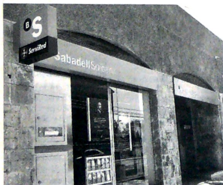
El banco mantiene su presencia latina en México.