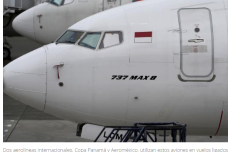
Das aerolíneas internacionales, Copa Panamá y Aeroméxico, utilizan estos aviones en vuelos ligeros a Colombia.

POR: PORTAFOLIO · MARZO 13 DE 2019 · 11:21 P.M.