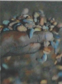
Santander aporta el 45% de la producción nacional de cacao.

Como se recordará, en el corrido del 2018 la producción de granos aromáticos se redujo sustancialmente, afectada, principalmente, por alta incidencia que tuvo la ola invernal en