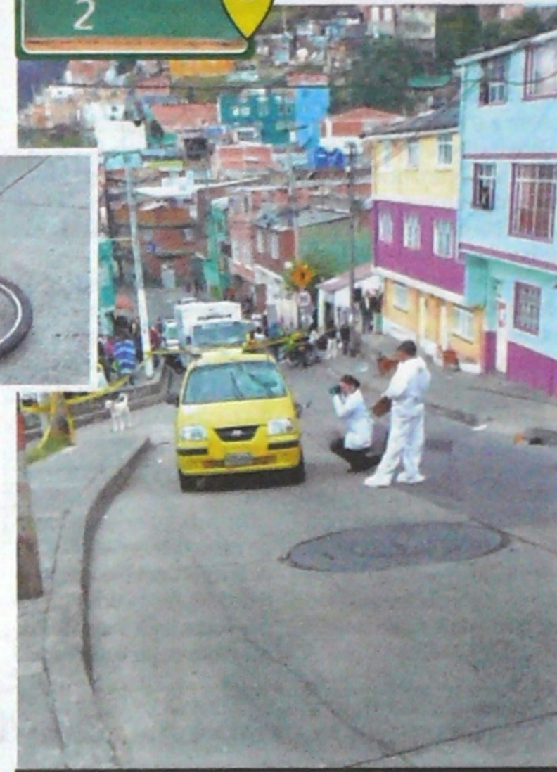
El levantamiento se realizó a las 8 de la mañana.