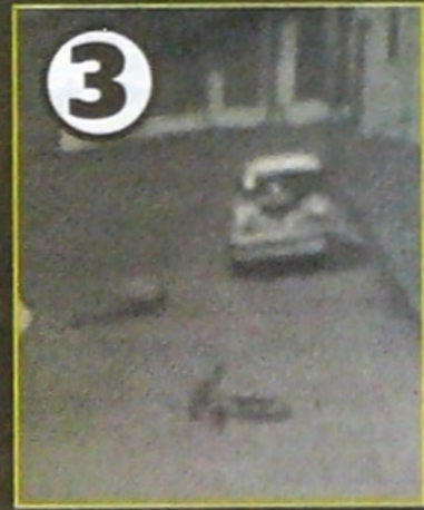
El ciclista, quien bajaba a alta velocidad, chocó de frente contra el taxi.