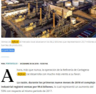
Ventas de Reficar el mercado local alcanzaron los $6,2 billones que representaron 25,7 millones de barriles de productos.