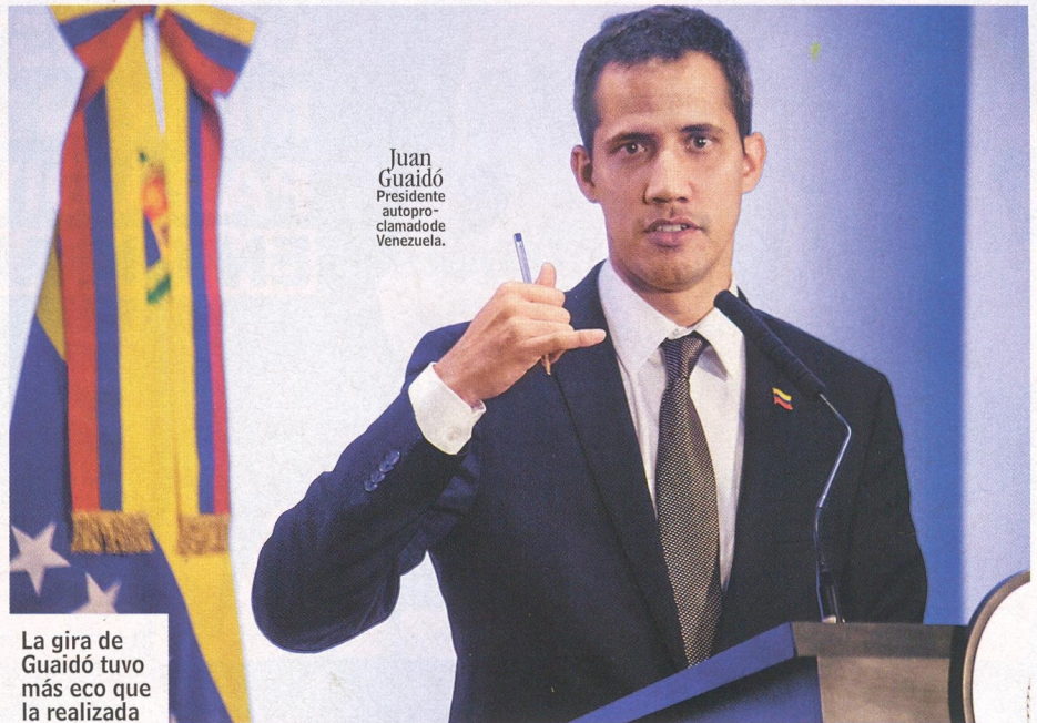
Juan Guaidó Presidente autoproclamado de Venezuela.

El bloqueo de las cuentas por medio de las cuales llegaban a Venezuela los pagos por las ventas de petróleo se suma a las amenazas de Donald Trump a quienes busquen darle oxígeno a Maduro ya sea al financiar deuda externa o al