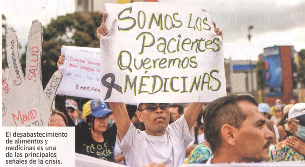
El desabastecimiento de alimentos y medicinas es una de las principales señales de la crisis.

La vicepresidenta Delcy Rodríguez anunció en Moscú que su país trasladará a Rusia las oficinas de Pdvsa en Europa, que hoy funcionan en Portugal. Pero