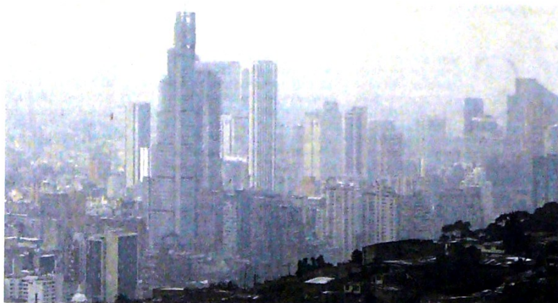
Imagen desde los cerros orientales hacia el occidente tomada ayer jueves.

Documento oficial revela coincidencia entre altos niveles de contaminación y aumento de enfermedades respiratorias.