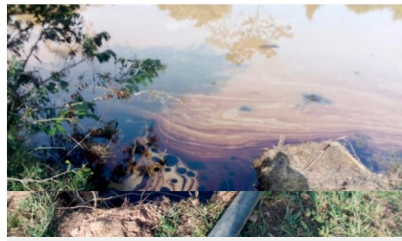
BLU Radio. Contaminación en bloque del pozo Lizama

Habitantes instauraron varias acciones de grupo y tutelas en busca de una indemnización y compensación ambiental.