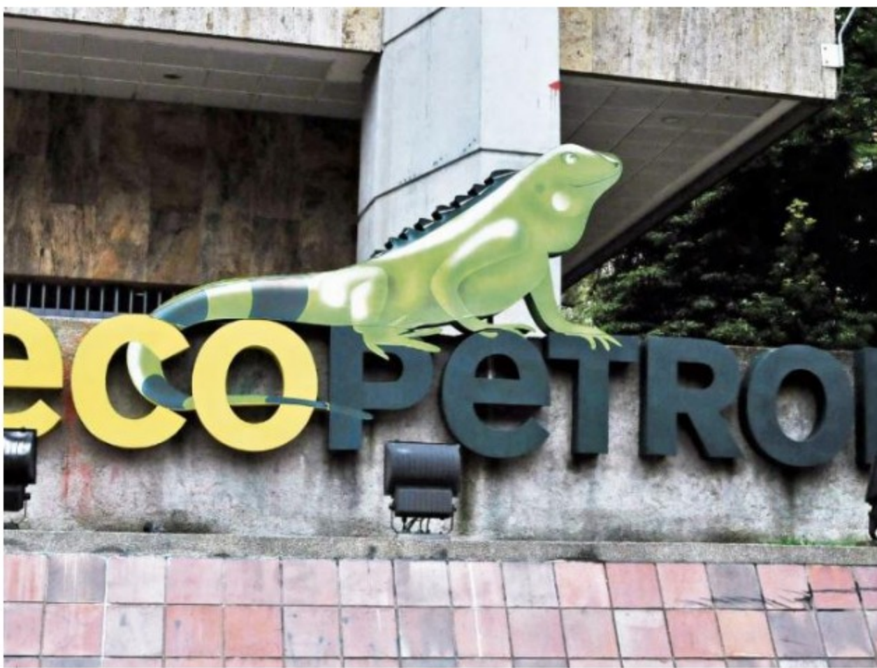
Con los nombramientos, Ecopetrol marca nueva etapa.

POR: BLOOMBERG · MARZO 07 DE 2019 · 10:04 A.M.