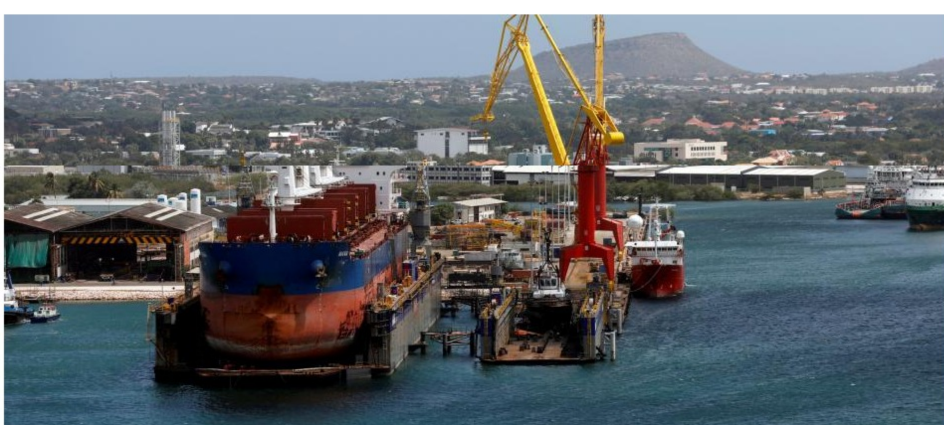
Las ventas de petróleo representaron el 92 por ciento de las exportaciones totales de Venezuela el año pasado.