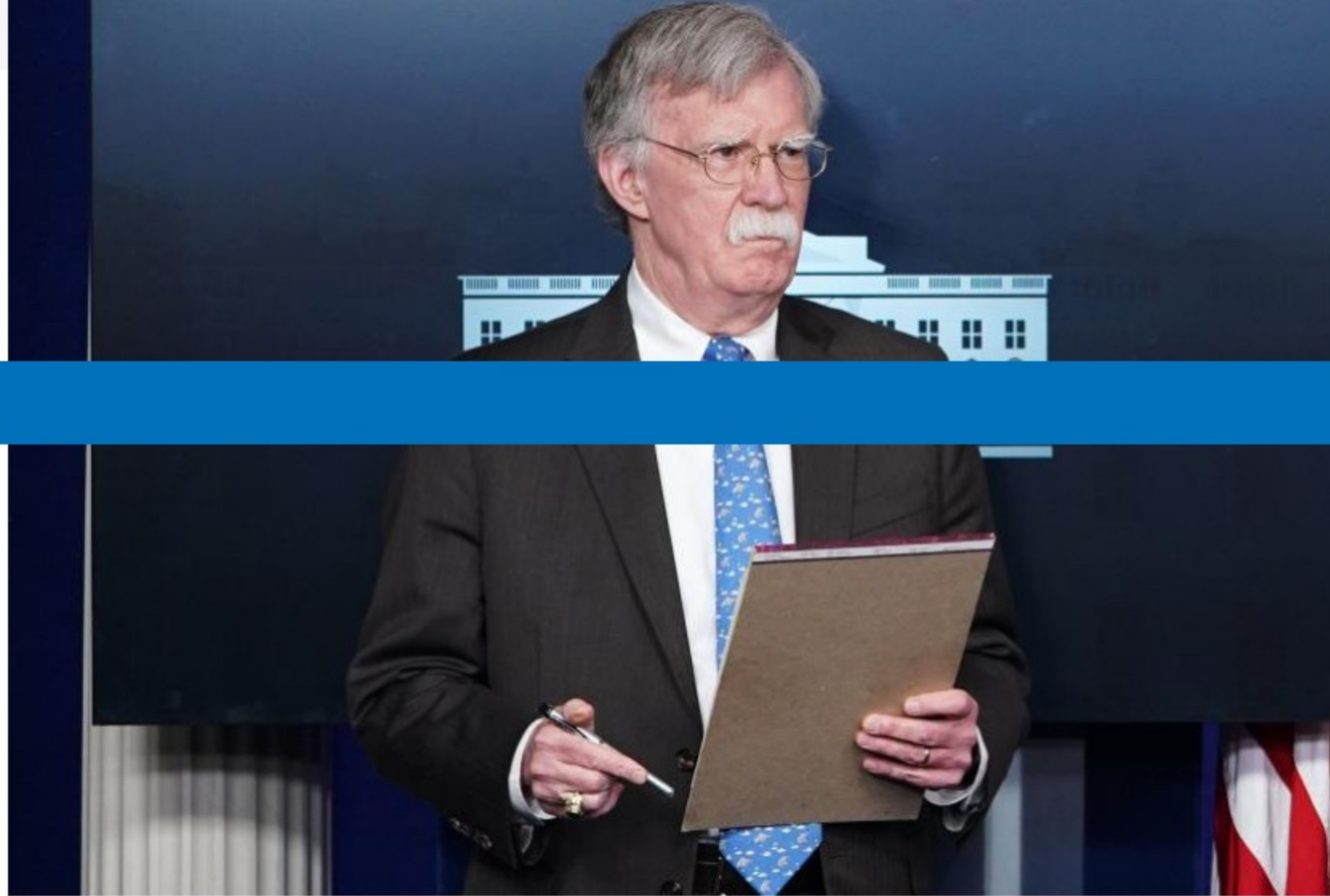
John Bolton, Consejero de Seguridad Nacional de Estados Unidos, hizo el anuncio de las ayudas.

Estados Unidos tomará medidas punitivas contra las organizaciones extranjeras que ayuden a financiar al mandatario de Venezuela, Nicolás Maduro, cuya autoridad desconoce, dijo el miércoles el consejero de seguridad nacional de la Casa Blanca, John Bolton.