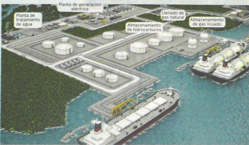
Infraestructura. El plan de la Sociedad Portuaria Energética Multipropósito en Buenaventura es tener en un mismo espacio las dos plantas térmicas, la planta regasificadora y un puerto de hidrocarburos.

Dos de los proyectos avalados por el Gobierno en la reciente subasta se construirán en Buenaventura.