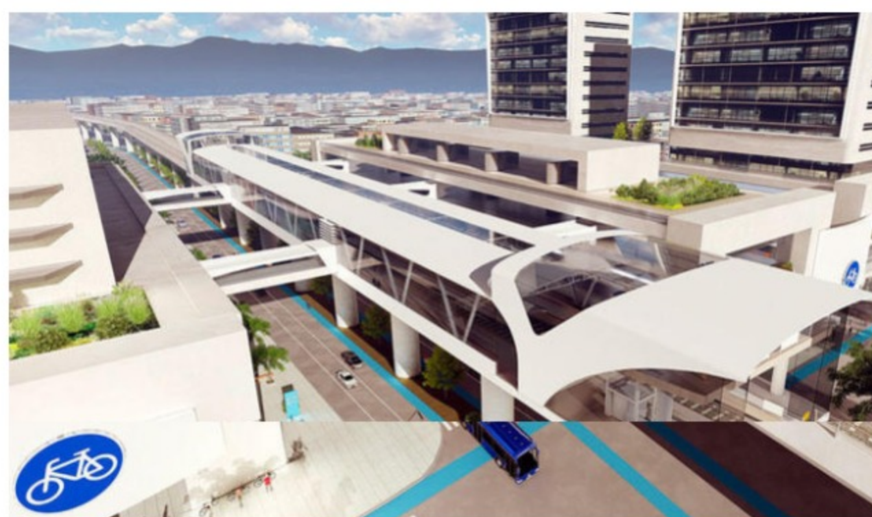
BLU Radio, Metro de Bogotá / foto: Alcaldía

Desde el Polo se ha indicado que el proyecto es ilegal y no hay respuesta suficiente sobre los estudios y la viabilidad en la construcción.