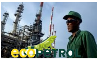
¿Invertirá Ecopetrol en refinación y en petroquímica? ¿En transición energética? ¿Se llevará el gobierno todas las utilidades?

Este es un espacio de expresión libre e independiente que refleja exclusivamente los puntos de vista de los autores y no compromete el pensamiento ni la opinión de Las2Orillas.