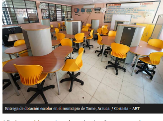
Entrega de dotación escolar en el municipio de Tame, Arauca.

La figura, creada para pagar el impuesto de renta a través de iniciativas de educación, para pagar, entre otros, fue adoptada en la reforma tributaria de 2016. De las 23 obras aprobadas en 2018 solo se han entregado dos.