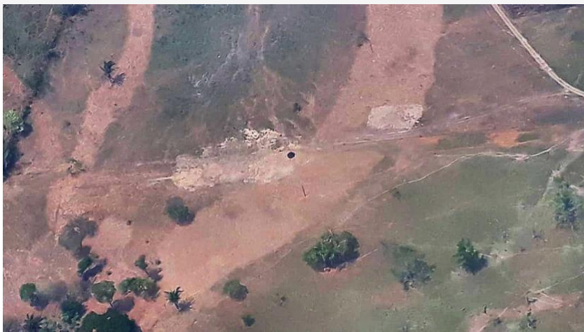
Se registró el segundo ataque contra el oleoducto Caño Limón Coveñas en menos de una semana en Saravena (Arauca).

E copetrol confirmó que se registró un nuevo ataque con explosivos contra el oleoducto Caño Limón Coveñas en jurisdicción de la vereda La Pajuela del municipio de Saravena en Arauca.