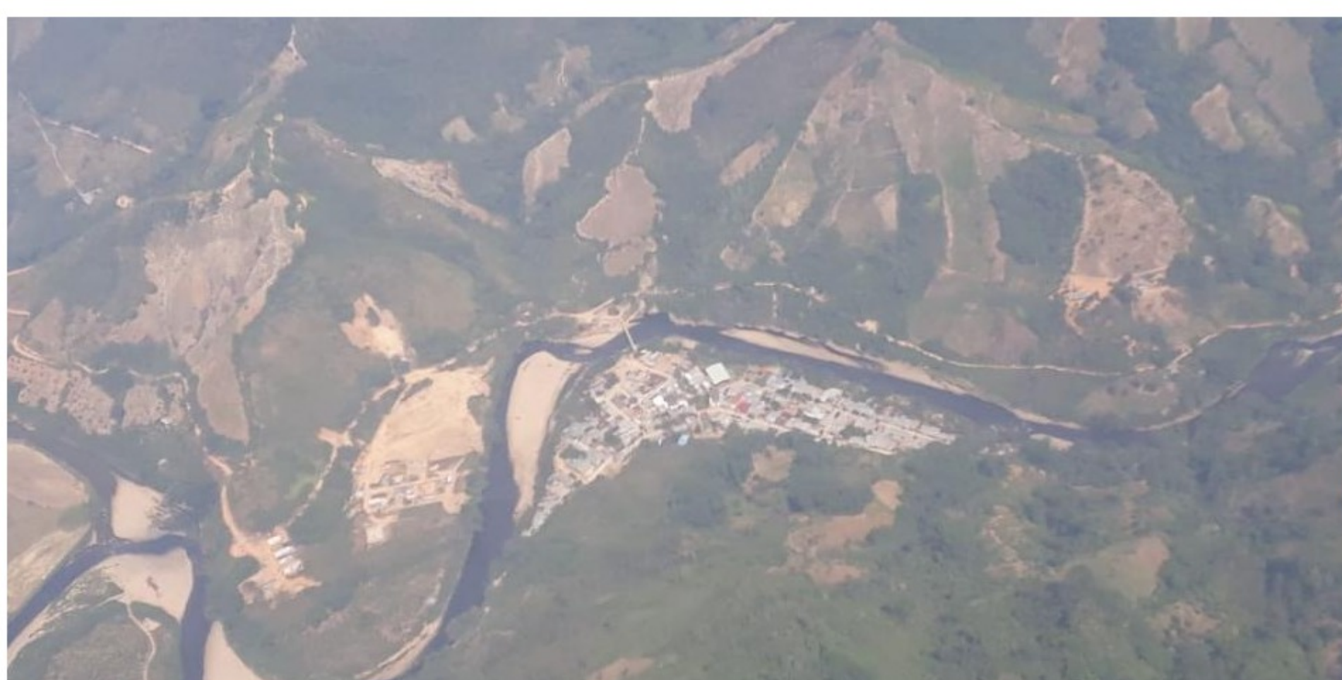
Esta panorámica del río Catatumbo dimensiona el daño ambiental producto de un atentado del Eln

RELACIONADOS: OLEODUCTO CAÑO LIMÓN COVEÑAS | TEORAMA | COMBATES