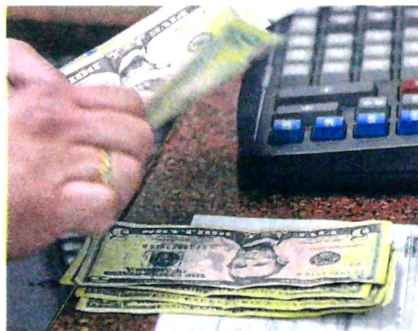
Las cifras fueron entregadas en la balanza de pagos.

Y agregó que: "antes veníamos haciéndolo con inversión extranjera, pero ahora lo que se ve es que esta empieza a caer, entonces ahí entran a jugar remesas que crecieron y, por ende, contribuyen a cerrar ese déficit. Ahora, lo que se espera es que hacia el futuro ese déficit de balanza co-