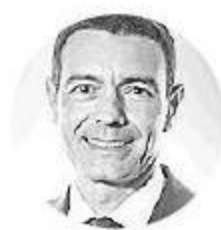
Lucio Rubio Director general de Enel en Colombia

INDUSTRIA. LAS UTILIDADES DE LA COMPAÑÍA PETROLERA SUBIERON 73,7%, Y FUE EL CRECIMIENTO MÁS ALTO ENTRE LAS 13 COMPAÑÍAS QUE HAN REPORTADO SUS ESTADOS FINANCIEROS DE 2018