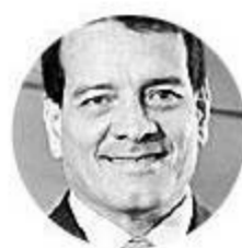
Felipe Bayón Pardo Presidente de Ecopetrol

“Obtuvimos excelentes resultados gracias al buen desempeño operativo de nuestro parque de generación y una estrategia comercial dinámica”.