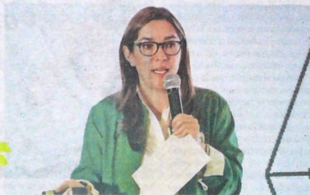
LA MINISTRA de Minas y Energía, María Fernanda Suárez, dijo que "se inició la revolución de la energía en el país con la subasta".

"Hoy se inicia una verdadera revolución en generación de energía. Energía más barata, energía que protege el ambiente, una matriz