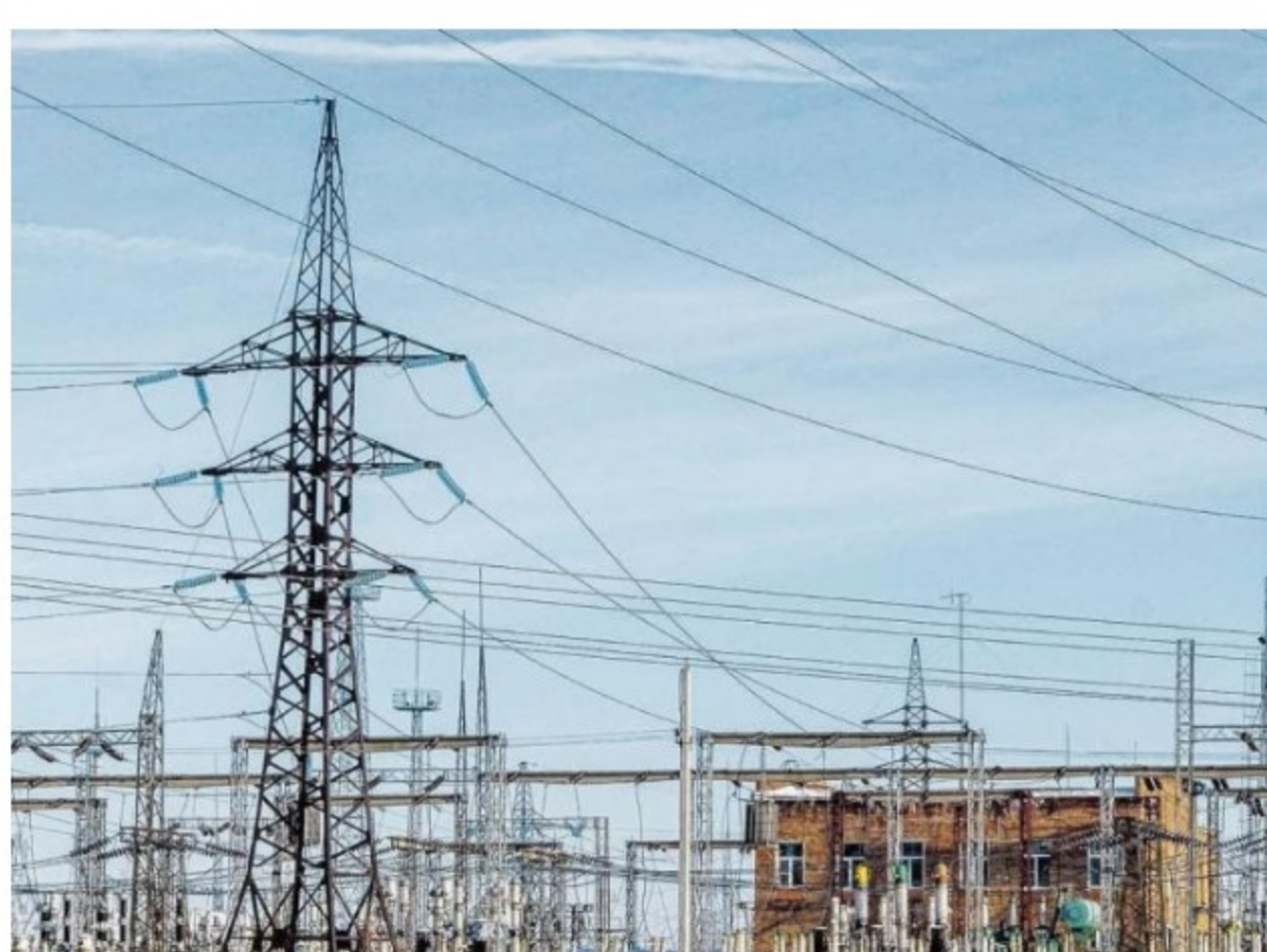
Hidroituango participó en la subasta.

POR: PORTAFOLIO · MARZO 01 DE 2019 · 09:01 A.M.