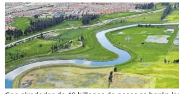
Con alrededor de 40 billones de pesos se harán las transformaciones planeadas para la ciudad.