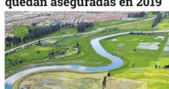
Con alrededor de 40 billones de pesos se harán las transformaciones planeadas para la ciudad.