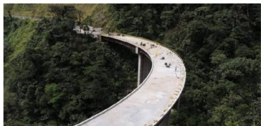
Puente Campucana, variante San Francisco - Mocoa.

Luego de que el gobierno del presidente Iván Duque Márquez sorprendiera con la exclusión de Nariño de todas las inversiones prioritarias en el Plan Nacional de Desarrollo, la dirigencia regional pidió que se revalúe esta posición y se incluyan como la variante San Francisco-Mocoa.