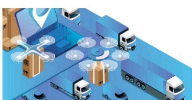
Logística y transporte con disrupción, emprendedores sobre ruedas