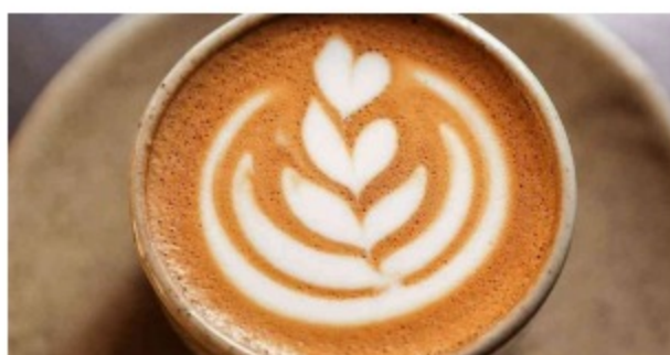
La "enorme angustia" en Colombia por la continua caída del precio del café