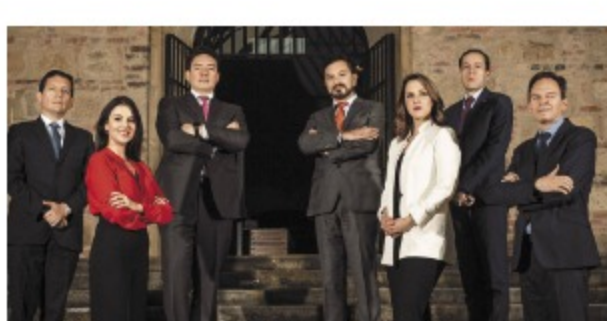
El equipo de la Superintendencia de Industria y Comercio