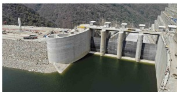
Hidroituango, semana agitada