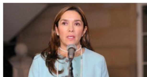
Lista la energía para cubrir a Hidroituango