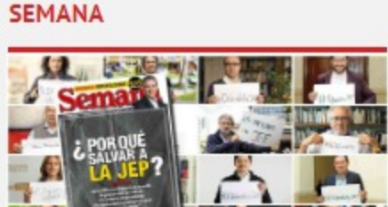
¿Por qué salvar a la JEP?