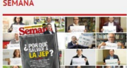
¿Por qué salvar a la JEP?