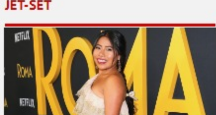
Yalitza Aparicio, una indígena mexicana que seduce a Hollywood