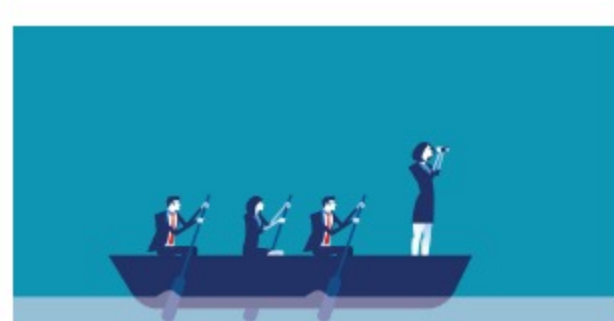
Seis claves para ser buen jefe