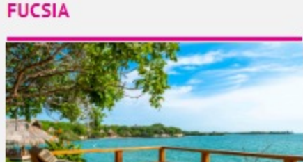
Así se ve el eco hotel más lujoso de Colombia