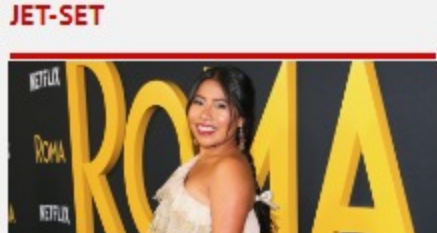
Yalitza Aparicio, una indígena mexicana que seduce a Hollywood