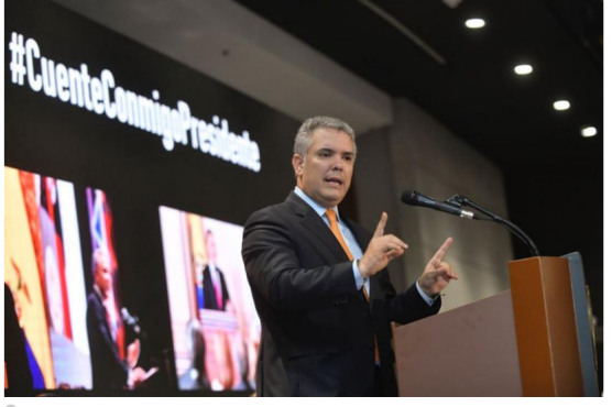
Presidente Iván Duque, durante encuentro con 500 empresarios del país.

Cerca de 500 empresarios se reunieron con el presidente de la República, Iván Duque, y le expresaron su respaldo total entorno a las decisiones que ha tomado en materia económica y frente a la paz.