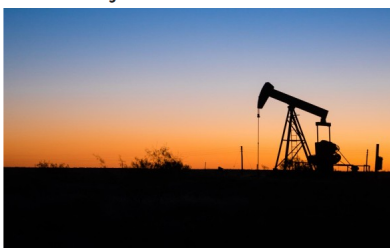
La fracturación hidráulica (fracking) es una técnica para aumentar la extracción de gas y petróleo que consiste en inyectar fluidos a presión en los suelos (esquistos) para fracturar las rocas y sacar los recursos. FOTO

CIENCIA MEDIO AMBIENTE AGENCIAS AFP Y EFE | PUBLICADO HACE 6 HORAS