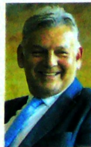
Jaime A. Cabal presidente de Fenalco

"Creo que es muy importante que los gremios, respetando nuestras diferencias naturales de defensa de los intereses, construyamos una agenda propositiva común de país, que sea una carta de navegación del sector empresarial a mediano y largo plazo, que permita con este y el próximo gobierno desarrollar temas fundamentales para ese 'nuevo escenario de Colombia como país atractivo para hacer negocios e invertir'", precisó el vocero gremial.