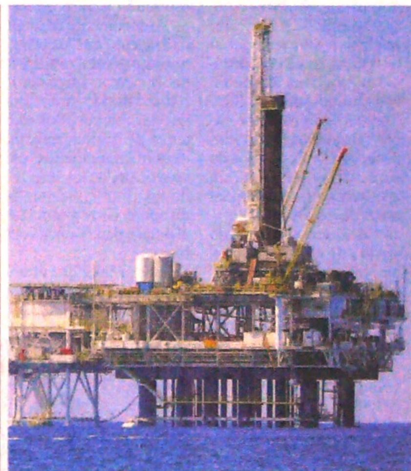
La cotización del crudo Brent ha subido este año un 28%.

El consejero estadounidense de Seguridad Nacional, John Bolton, había afirmado la víspera en Abu Dabi que Irán estaba “muy