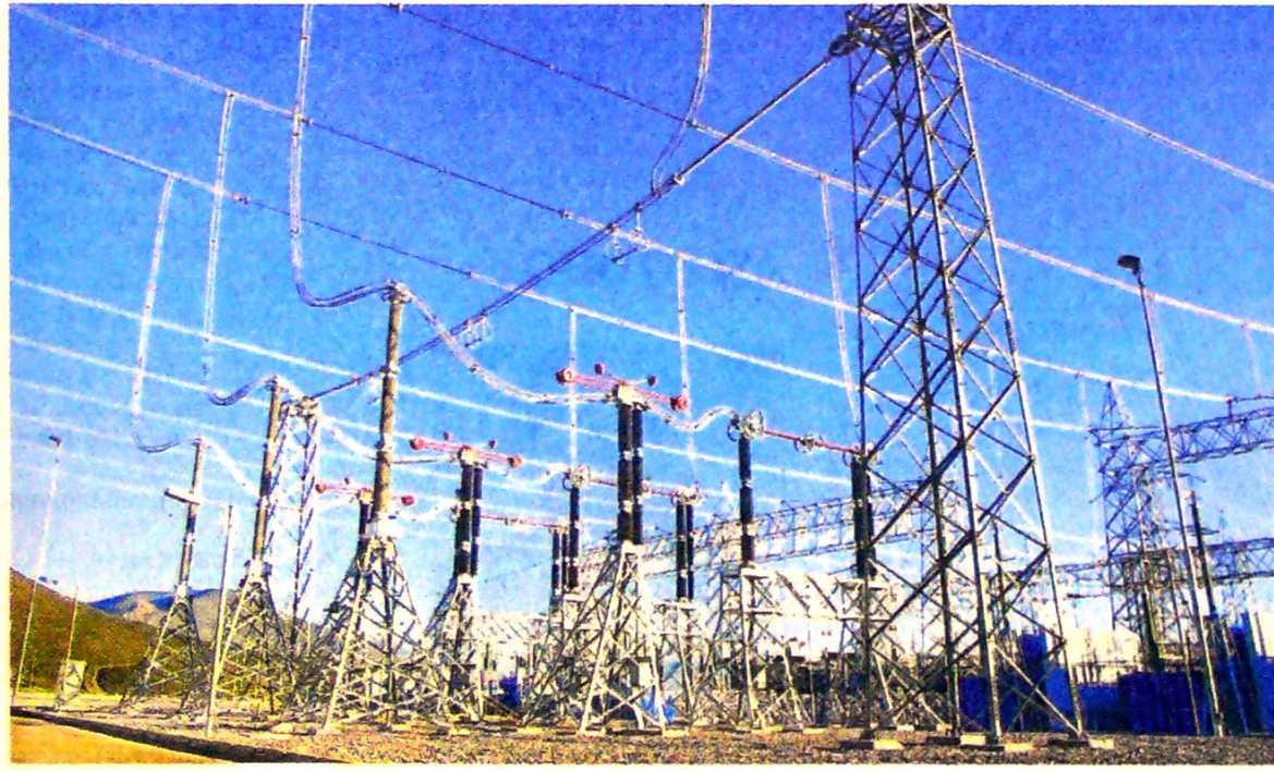
Esta infraestructura es la más importante de ese país en 50 años y recorre 753 kilómetros.

Tras cinco años de no entregar un solo bloque para su desarrollo, la ANH habilitó a las empresas que participarán en el proceso permanente de asignación de áreas, con el que se dará más impulso a la industria colombiana de hidrocarburos. Pág. 6