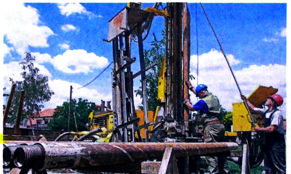
La ANH estima que en los 20 bloques hay reservas de 1.000 millones de barriles.

Julio César Vera, consultor y experto en el tema.