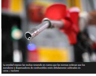
La entidad impuso las multas teniendo en cuenta que las normas ordenan que los surtidores y dispensadores de combustibles estén debidamente calibrados en ceros.

Las multas de multas incluyen también a 10 personas naturales y ascienden a $682.367.584.